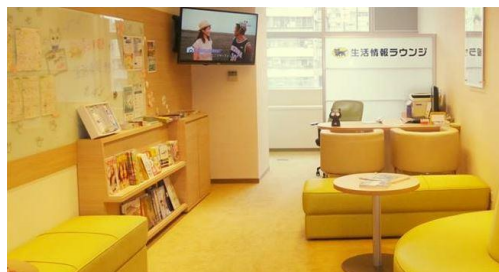
明るく居心地の良い雰囲気のある台湾の「生活情報ラウンジ」。ここではバザーなどのイベントも開催。

当社は海外引越専門のサービス拠点が日本に18か所あり、経験と知識を兼ね備えた専門スタッフがいます。また、赴任前には、ご赴任される方とご家族を対象とした赴任までに必要な準備、現地での生活情報などをわかりやすくご説明する海外生活セミナーや、企業の担当者様には、企業としての危機管理体制などを外部講師を招いて行うなど企業向けのセミナーを、サービスの一環として、東京だけでなく、各地で定期的開催しています。